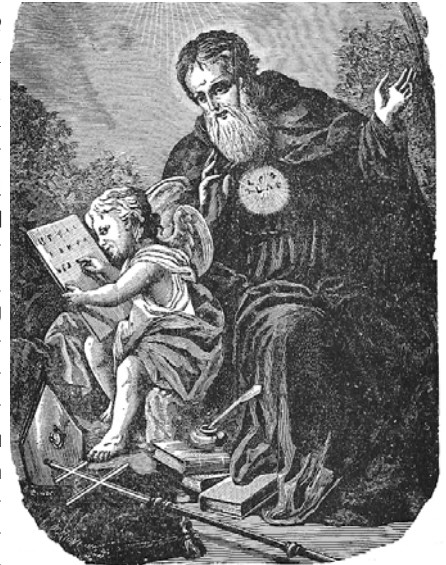
ST. MESROB MASHDOTZ

Որոնք աննախընթաց եւ զարմանահրաշագարագաներու րակ՝ Տայ Մշակոյթի Ոսկեդարը կերտեցին: Այդ իսկ պարճառաւ Տոկրտմբեր ամիսը նուիրուած է անոնց կարարած մշակութային գործունէութեան ներքուման, զոր ամէն րարի ոգեկոչումի եւ յիշարակի հանդէսներով մերու պարարբառ հայկազուններս կը պանծացնենք անոնց երախարաշար եւ երախարածան աշխարանքը: