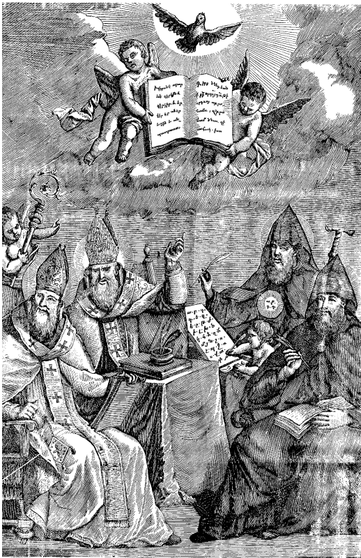
Սրբոց Թարգմանչաց Վարդապետաց Holy Translators

Մակեդոնական փրկապետության շրջանին թէեւ Նելլենական մշակոյթը, արուեստները եւ արեւմտեան մտայնութիւնը փարածուած, որդեգրուած եւ փրկապետող