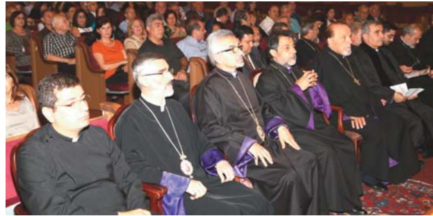
Սարգիսեանի հետ, ներկայութեամբ աւելի քան 600 հայորդիներու:

Չորեքշաբթի, 15 Հոկտեմբեր 2014-ի երեկոյեան, Կլենտէյլի Ս. Աստուածածին եկեղեցւոյ մէջ տեղի ունեցաւ ժողովրդային հանդիպում մը, Բերիոյ Թեմի Առաջնորդ եւ «Սուրիոյ Շտապ Օգնութեան եւ Վերականգնումի Մարմին»ի ատենապետ Բարձր. Տ. Շահան Ս. Արք.