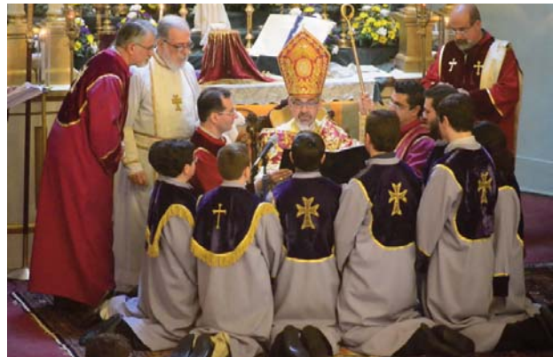
Կիրակի, 19 Յունուարին, Թեմիս բարեշան Առաջնորդ Բարձր. Տ. Մուշեղ Ս. Արք. Մար-